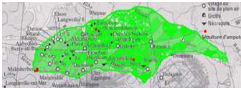
Figure 1 : Localisation des premières amputations connues (premiers agriculteurs du Rubané)

Les premières sépultures comprenant des personnes amputées ayant survécu après l'amputation et dont les éléments de contexte laissent supposer un geste ayant une dimension volontaire aussi bien du praticien que du patient appartiennent à une population pratiquant une agriculture sur brûlis, et dont la signature archéologique est le tracé géométrique des dessins sur les poteries servant à la conservation des aliments, le Rubané. Le groupe de population plus à l'Est est celui des Anatoliens. Les sépultures des Anatoliens contiennent des traces de traumatismes violents sans intervention de type chirurgical. Appartenant à une époque postérieure, les agriculteurs du Rubané ont domestiqué les animaux de grande taille, en particulier les bovidés, et ont pratiqué des actes médicaux complexes, comme des trépanations et des amputations.