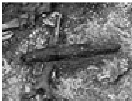
Figure 2 : Position de l'humerus et de l'objet en silex dans la tombe 416 de Buthiers-Boulancourt